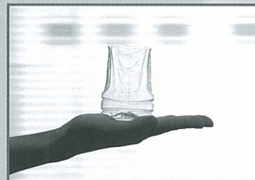
▲この形にして当日お持ちください