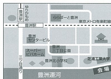
会場 豊洲運河(芝浦工業大学横船着き場)